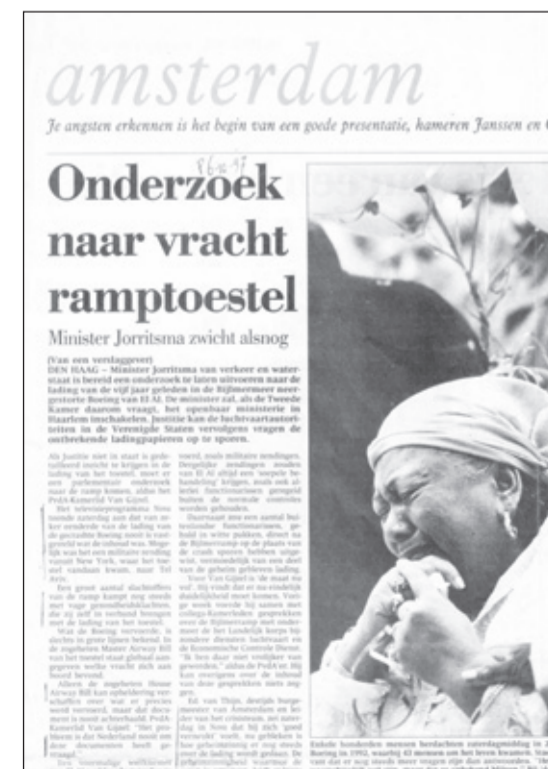
Artikel in het Parool over het onderzoek naar de vracht van het vliegtuig, 6 oktober 1997.

We leven nu in 2022, dertig jaar na de ramp, en nog steeds zitten mensen met vragen, nog steeds vragen mensen zich af, wat er nu echt allemaal in dat vliegtuig gezeten heeft. Dat zijn vragen die nooit beantwoord zijn, en of de waarheid boven tafel komt blijft gissen. Misschien dat de Israëlische documentaire ons meer duidelijkheid zal geven.