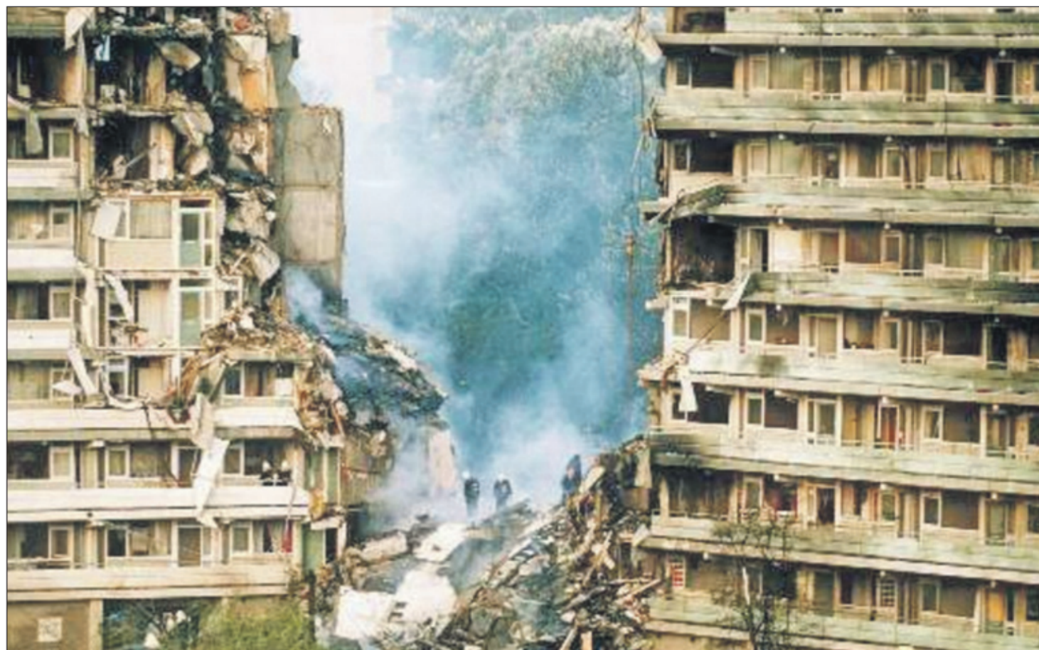
Het El Al-toestel boorde zich vrijwel verticaal in de galerij tussen de flats Groeneveen en Klein-Kruitberg.

Makdoembaks: „Er zijn onderzoeken gedaan, van klein tot groot. Van een gecoördineerde en integrale aanpak was echter geen sprake. Wat bijvoorbeeld grotendeels veronachtzaamd bleef, waren de medische gevolgen voor bewoners van de getroffen wijk.”