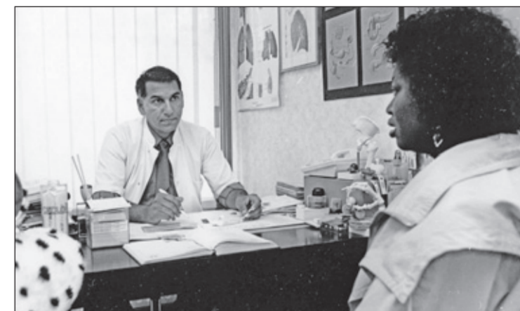
Huisarts in gesprek met een Bijlmerrampslachtoffer, 1993.

Eind van het jaar gaat er ook een Israëlische documentaire van de internationaal bekende documentairemaker Noam Pinchas in Amsterdam in première: 'Murky skies'. Deze documentaire is geen fictie en geen thriller, maar een uiterst gedetailleerd verhaal over een minireportage, dat plaatsvond in het hartje van West-Europa. Het gaat over grote financiële en politieke entiteiten die meer aan